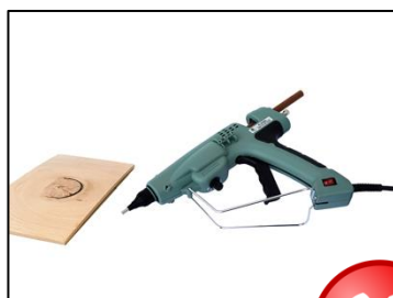
Lægges aldrig på siden!